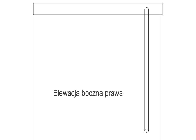
Elewacja boczna prawa