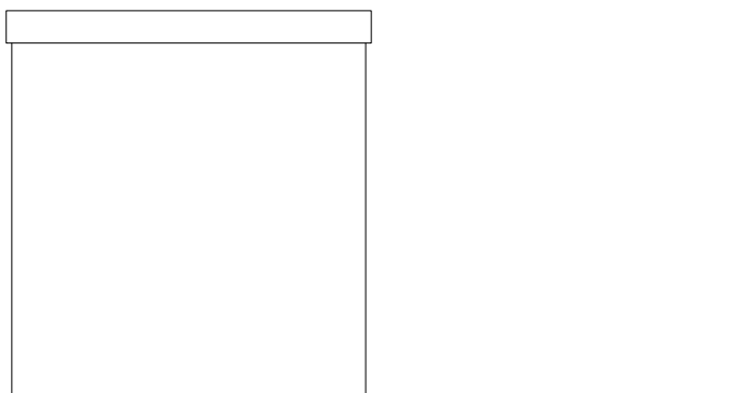
Elewacja boczna lewa